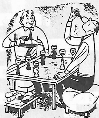
"This is my new invention." Cartoon by J. Hegen ("Frischer Wind").